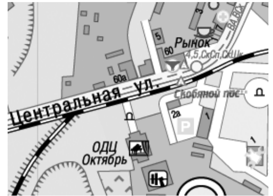
г. Сергиев Посад, ул. Центральная, у д. 76