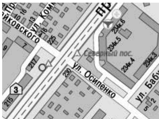
г. Сергиев Посад, ул. Осипенко, за автобусной остановкой