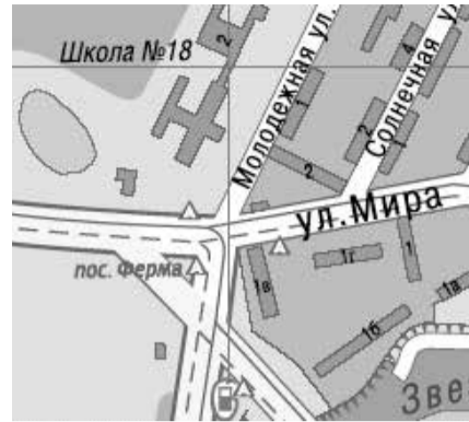
г. Сергиев Посад, м-н Ферма, у КПП