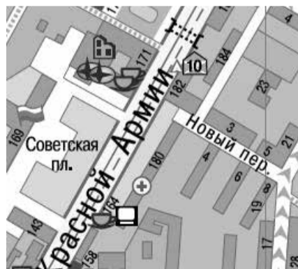
г. Сергиев Посад, пр-т Красной Армии, у д. 186/2