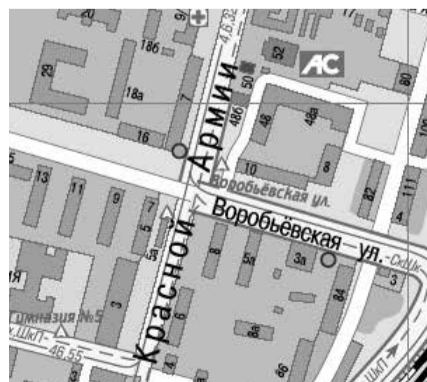
г. Сергиев Посад, между д. 7 по пр-ту Красной Армии и д. 18 по ул. Воробьевская