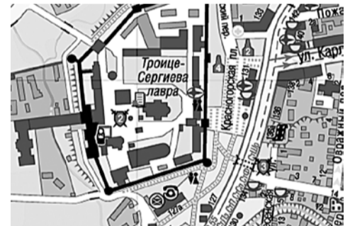
г. Сергиев Посад, пр-т Красной Армии, у Белого пруда