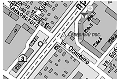
г. Сергиев Посад, ул. Осипенко, за автобусной остановкой