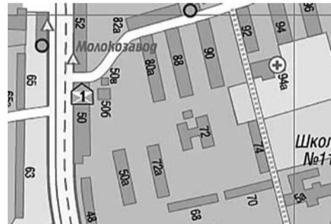
г. Сергиев Посад, Новоуличское ш., между д. 50 и д. 52