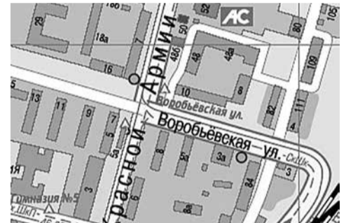
г. Сергиев Посад, между д. 7 по пр-ту Красной Армии и д. 18 по ул. Воробьевская