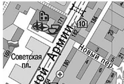
г. Сергиев Посад, пр-т Красной Армии, у д. 185 у афиш