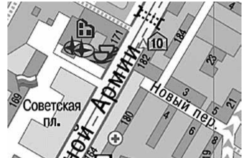
г. Сергиев Посад, пр-т Красной Армии, у д. 182