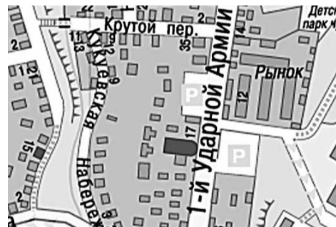
г. Сергиев Посад, ул. 1-ой Ударной Армии верхняя площадка СТП (у ограждения)